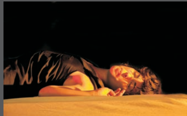
escenario 8x6 mtrs. (adaptable)